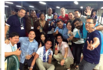
公益社団法人日本青年会議所 2014年度 国際アカデミー デリゲイツの仲間と