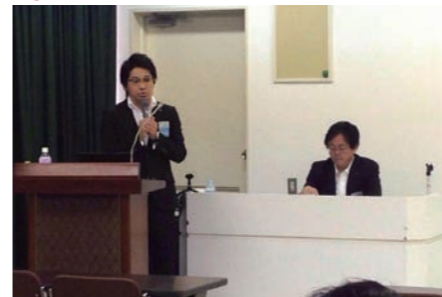
公益社団法人日本青年会議所 2014年度 褒賞委員会 JCIアワードセミナー講師