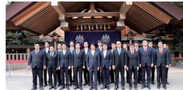
公益社団法人日本青年会議所 東海地区愛知ブロック協議会 2018年度 役員集合写真 熱田神宮にて