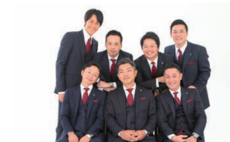
公益社団法人名古屋青年会議所 第67年度 正副団と共に