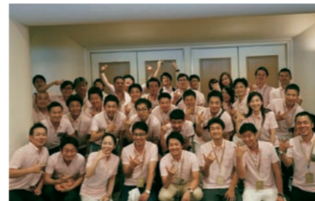
公益社団法人日本青年会議所 2016年度 共感ネットワーク構築委員会委員長 サマーコンファレンス フォーラム設営