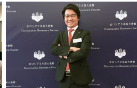
公益社団法人日本青年会議所 2016年度 共感ネットワーク構築委員会委員長 日ロ学生交流事業 在ロシア日本国大使館にて