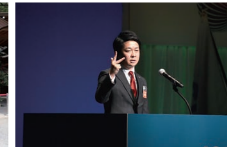
公益社団法人日本青年会議所 東海地区愛知ブロック協議会 2018年度 第60代会長として 名古屋会議 会長メインスピーチ