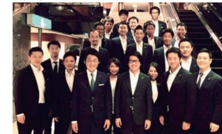
公益社団法人名古屋青年会議所 第65年度 渉外委員会委員長 サマーコンファレンス ナゴヤナイトにて